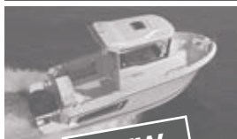
Merry Fisher 605 marlin