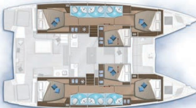
6 cabines, 6 salles d'eau / 6 cabins, 6 bathrooms

OPTION Cabine à tribord ou à bâbord Cabin on starboard or port