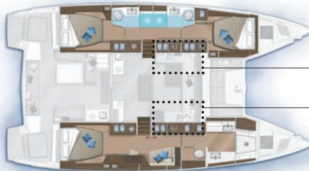
3 cabines, 3 salles d'eau / 3 cabins, 3 bathrooms