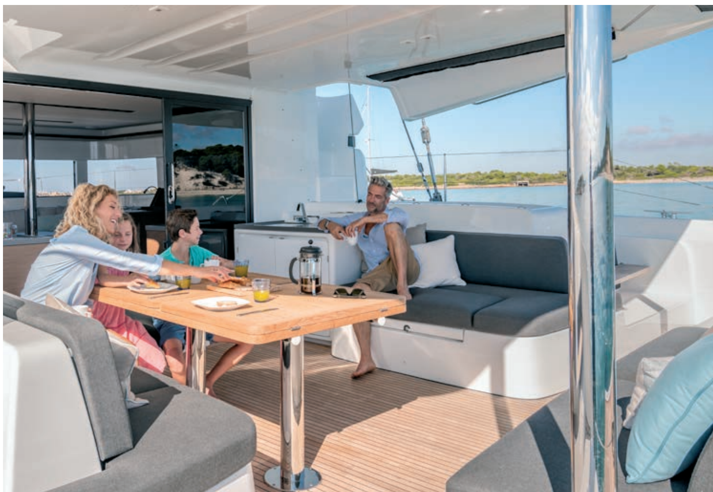
Table XXL accueillant jusqu'à 12 convives, cuisine d'extérieur équipée, le cockpit du Lagoon 50 maximise le confort. De plain-pied avec le carré aux vitrages généreux, il garantit la vision panoramique tout en offrant une protection maximale. Un must !