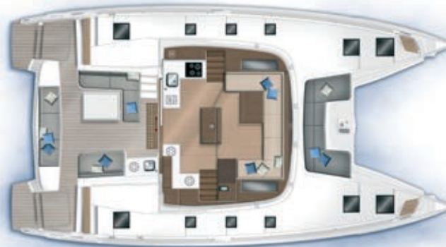
Carré et cockpit / Saloon and cockpit

The 50 with her various layouts offers to the owner many choices to customize his/her boat: dressing, additional cabin on starboard or port ... A modularity unique in this size of boat.