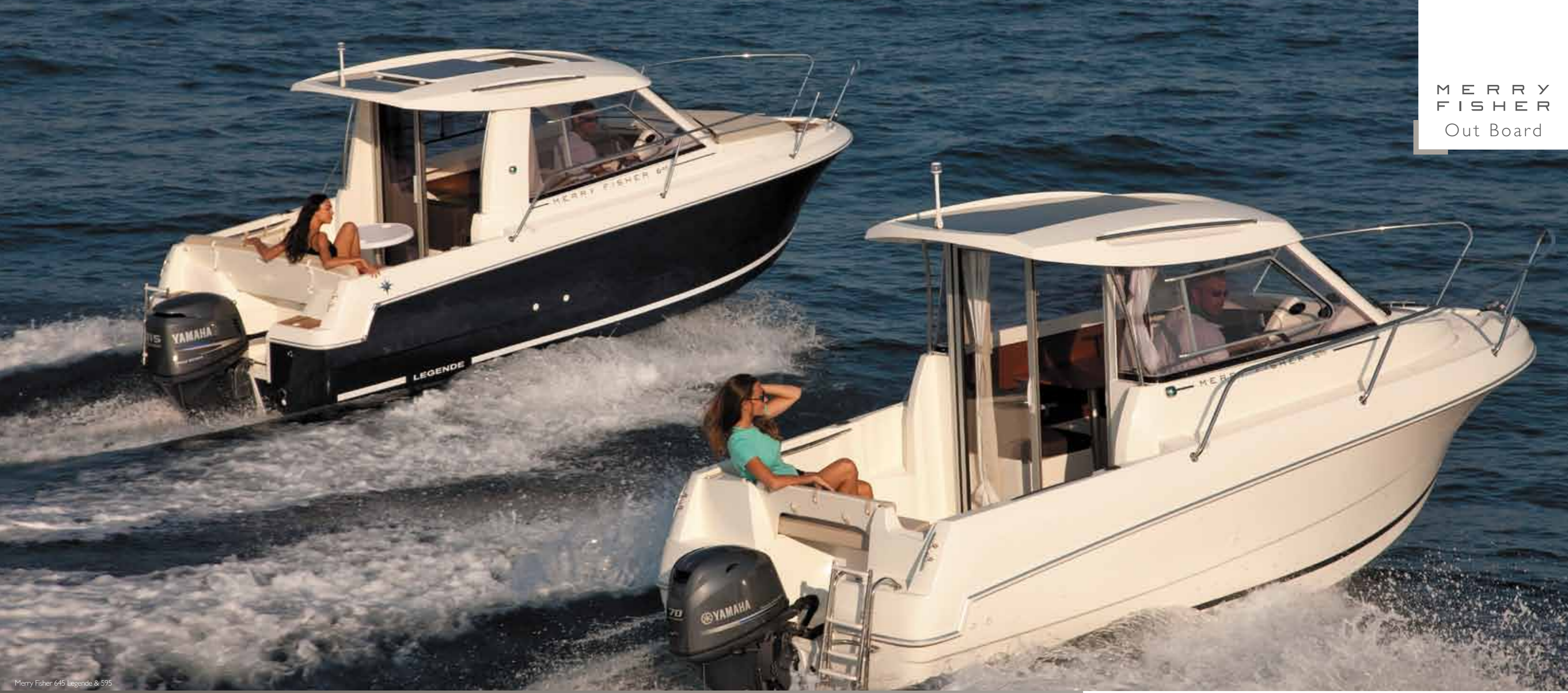
Merry Fisher 645 Legende & 595